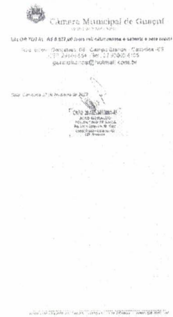
img256.jpg ~390 KB