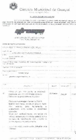
img255.jpg ~734 KB