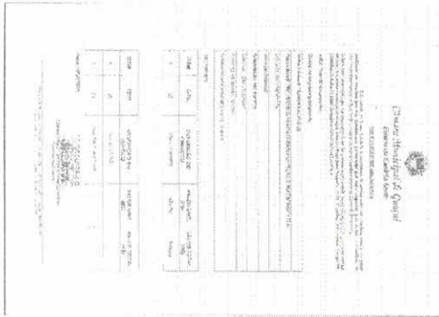
001.jpg ~349 KB